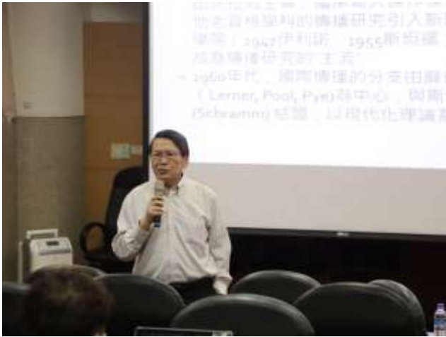
2021/5/5「內眷化與孤立：美國國內傳播與國際傳播主流文獻述評」(國立政治大學文學院)演講照片