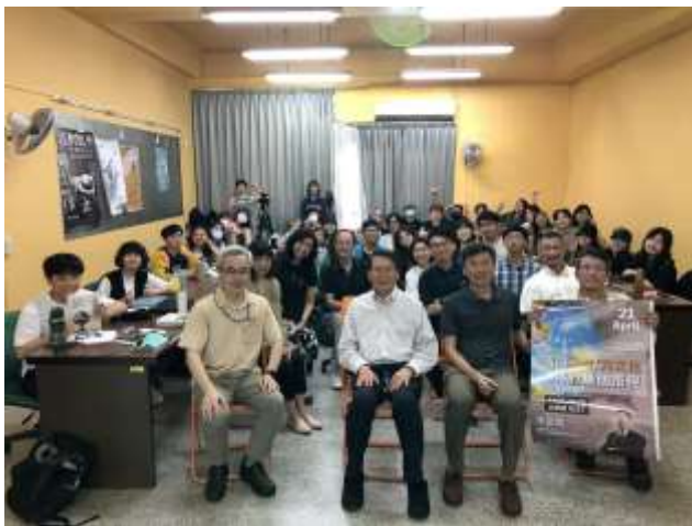
2021/4/21 「邁向國際/跨文化傳播的路徑」(國立中正大學電訊傳播研究所) 演講照片