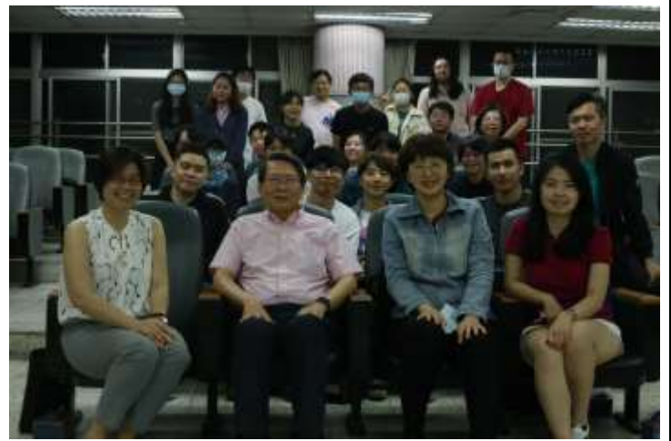
2021/5/7「《傳播縱橫》導讀：與研究生對話」(國立政治大學傳播學院)演講照片