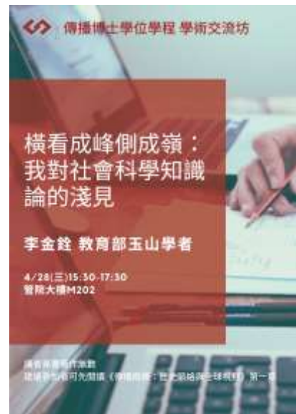
2021/4/28 「橫看成峰側成嶺：我對社會科學方法論的淺見」(世新大學傳播學院) 演講海報