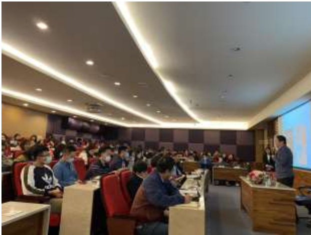
2020/11/11 「國際傳播」國際化」 (中國文化大學傳播學院) 演講照片