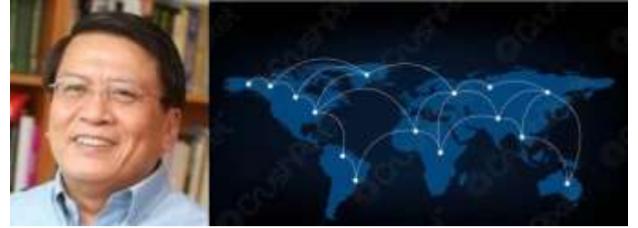
2021/3/24 Internationalize “International Communication” (Hong Kong Baptist University) 演講海報